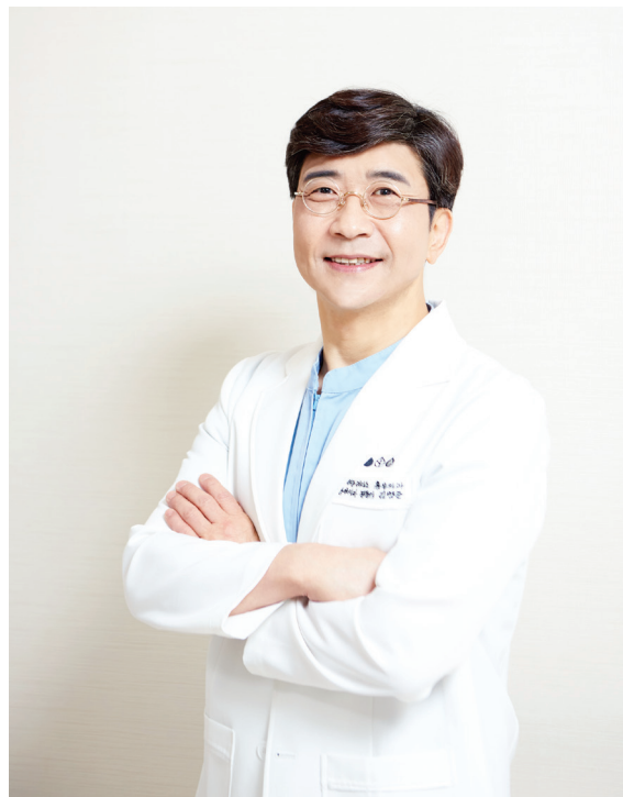
胸外科/专科医生 代表院长